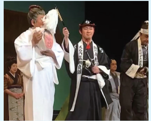
劇団青春座出演(大石内蔵助役)