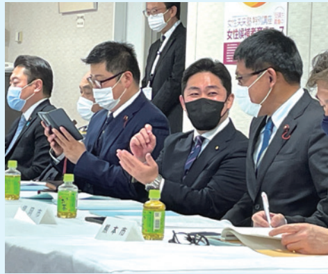
指定都市行財政問題懇親会に出席(自民党本部)