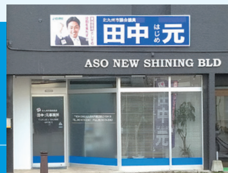
事務所移転しました(H30.12)