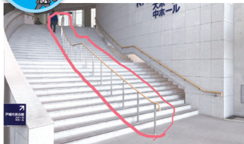
手すりの設置 (ウェルとばた内市民会館への階段)