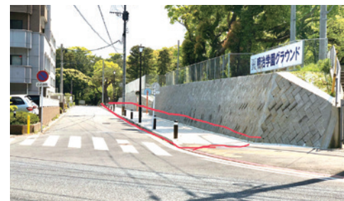
歩道の新設 (一枝2丁目付近)