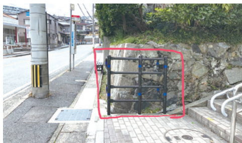
溝への落下防止のための柵設置 (西大谷1丁目5番)