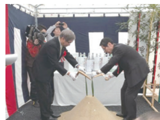
下水道整備起工式