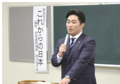
憲法改正は我々国民がしっかりとした事実を知らなければならぬと挨拶。

ご来場頂いた方には「初めて知った」「またこのような勉強会に参加したい」などといった貴重なご意見を頂きました。