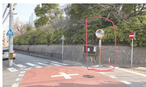
カーブミラーの設置 (高中生学校裏交差点)